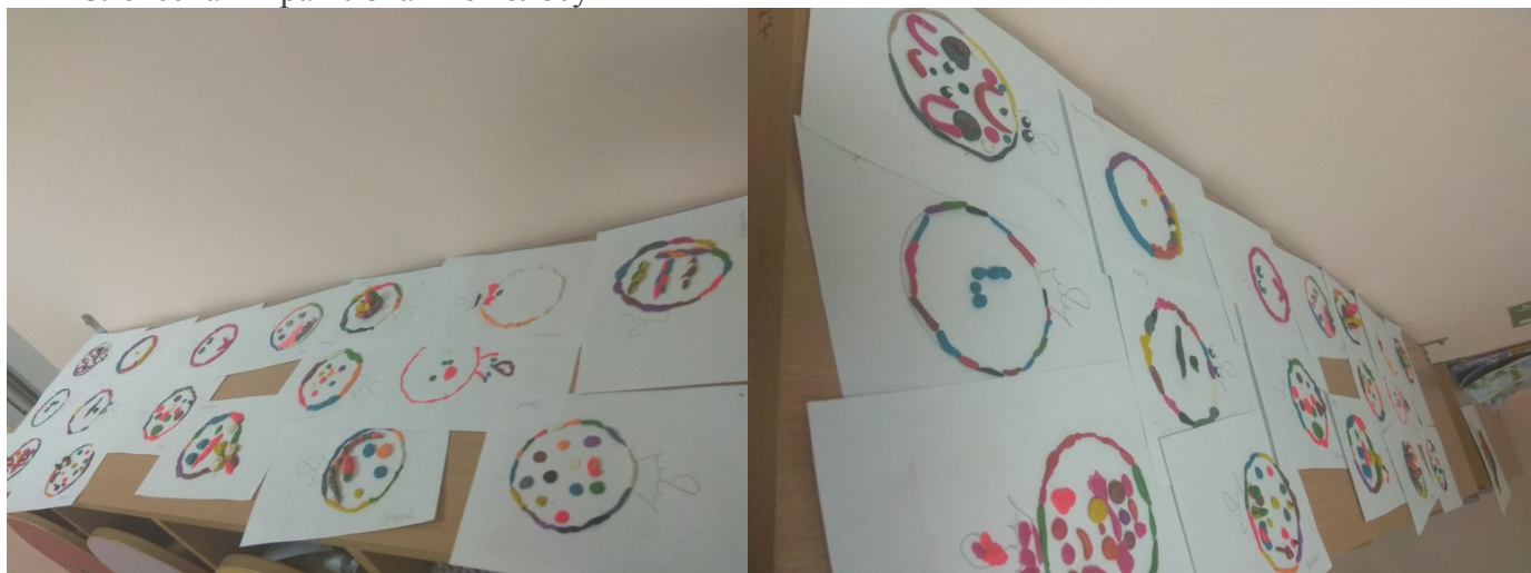
«Новогодние подарки для Кузи»