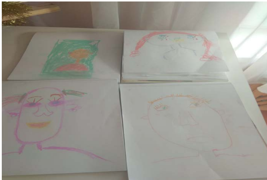
Портреты «Вот я какой».