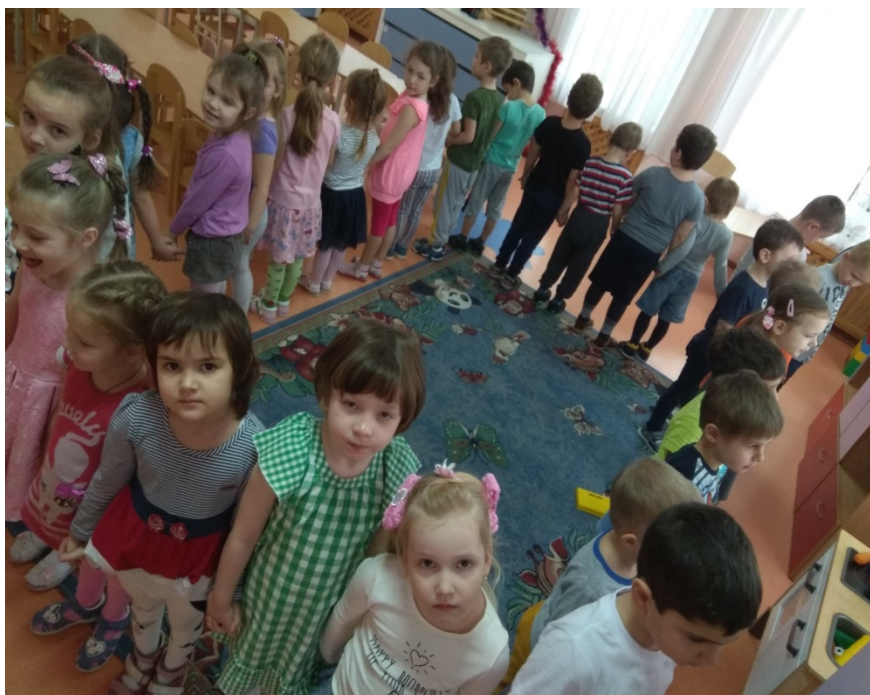
Словесная игра «Узнай по голосу»